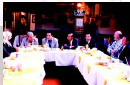
Los asistentes a la reunión quedaron satisfechos de como se dieron las cosas