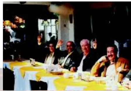
Los socios de CENAT en el momento de realizar la votación.