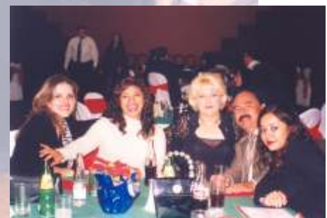
A la derercha: invitadas de Miviro Consultores.